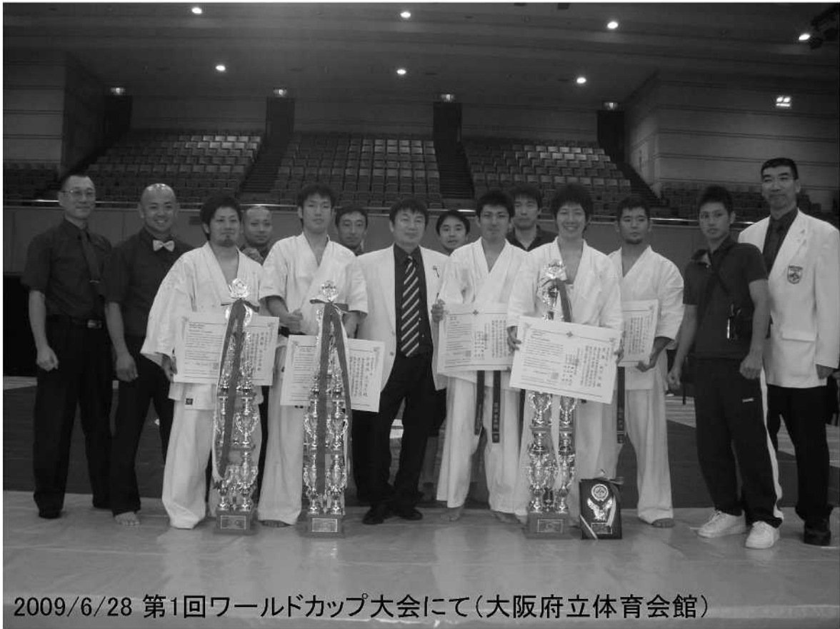
2009/6/28 第1回ワールドカップ大会にて(大阪府立体育会館)

ついに夏がもうすぐそこまで迫っています。「極真の夏」は行事が詰まっています。思い出作りの夏です。七月五日(日)夏季審査会、七月十二日(日)東北大大会(仙台森道場主催)、七月二十六日(日)関東大会、八月一日(土)〜二日(日)羽黒山夏合宿、八月三十日(日)団体戦・演武会です。一番自分が今やりたい事に参加して下さい。日頃は自分の道場の中でしか会っていない先輩、後輩や仲間ですが、行事に参加することにより、友達が出来たり、また、いつもとは違う先生や先輩に接する事が出来、自分の視野が広がっていきます。人と人との心の交流をする事も出来ます。